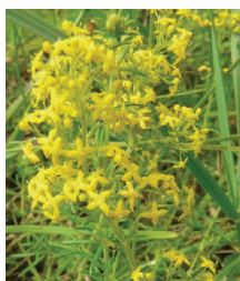
Echtes Labkraut ○