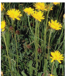
Milch- und Ferkelkräuter ○