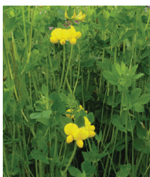
Gelbblütige Kleeart ○