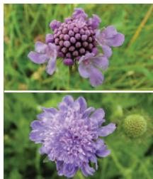
Tauben-Skabiose Acker-Witwenblume ○